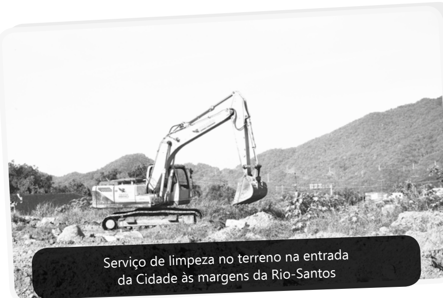
Serviço de limpeza no terreno na entrada da Cidade às margens da Rio-Santos

e foi alargada, passou de 9 para 13 metros. Agora, as pessoas podem andar de carro, sem se preocupar com os buracos. A UBS e a Escola Municipal Giusfredo Santini também ganharam melhorias: pintura interna e externa, poda de grama e troca de vidros quebrados. Para finalizar, na frente do Condomínio Itatinga, foi feita uma rampa de acesso.