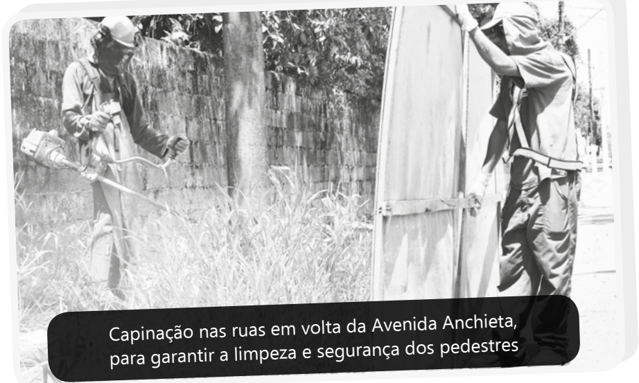
Capinação nas ruas em volta da Avenida Anchieta, para garantir a limpeza e segurança dos pedestres

Funcionários da Prefeitura intensificaram as ações de manutenção urbana nos bairros de Bertioga. A partir desta semana, uma nova roçadeira ajuda a fazer poda e retirada da grama ao longo dos 12 quilômetros da Avenida Anchieta. A máquina agiliza os serviços em áreas planas.