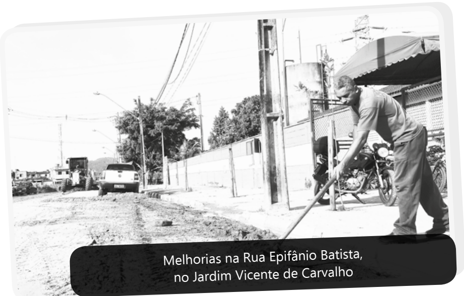
Melhorias na Rua Epifânio Batista, no Jardim Vicente de Carvalho