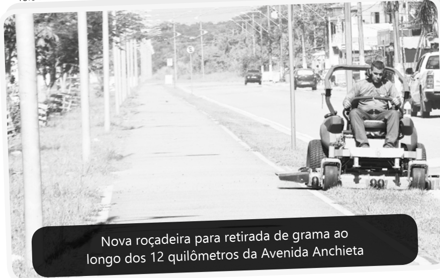
Nova roçadeira para retirada de grama ao longo dos 12 quilômetros da Avenida Anchieta