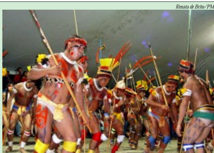
Resgate da cultura indígena transformou o evento no maior do gênero no País

O Dia Mundial de Combate à Tuberculose não é uma data para comemoração. É uma ocasião de mobilização mundial, nacional, estadual e municipal buscando envolver todas as esferas de governo e setores da sociedade na luta contra essa doença.