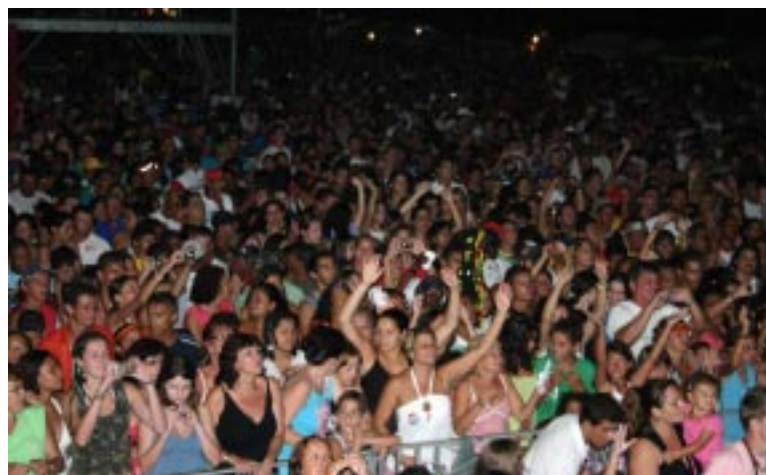
Uma multidão acompanhou o Falamansa na Enseada; hoje tem Rock Diggers

aulas de lambaeróbica e distribuição de brindes, além de som animando a população e turistas. Neste sábado, 13, o agito acontece em Boracéia, das 16h às 22h, e domingo (14) o trio invade a praia na Vista Linda, das 10h às 14h.