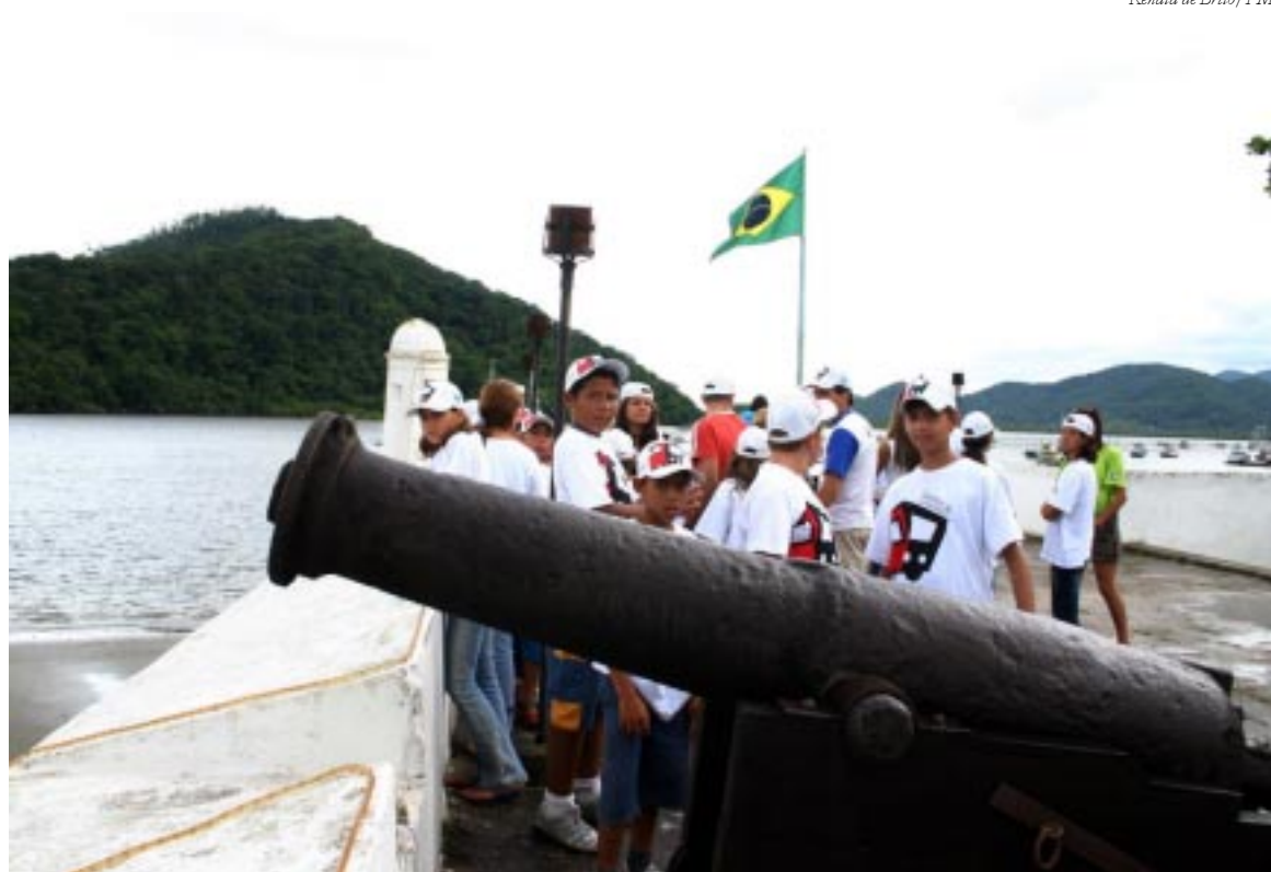
Visita ao Forte São João possibilitou aos alunos conhecer um pouco mais da história da colonização do Brasil

A alegria e descontração envolveram desde a meninada até os monitores e chamaram a atenção dos componentes da banda que adoraram a idéia do programa desenvolvido pelo Governo do Estado de São Paulo em parceria com as prefeituras do Litoral Paulista. Mas, além do show, que todos adoraram, não faltaram atividades e atrações para essa meninada gastar toda a energia. As crianças visitaram o Espaço Veja, na Riviera de São Lourenço, curtiram a praia na Riviera e o Cantão do Indaiá, conheceram a Prainha Branca, em Guarujá, assistiram demonstrações dos alunos da Academia de Boxe da Prefeitura de Bertiooga, passearam pela Feira de Artesanato e o calçadão da Avenida Vicente de