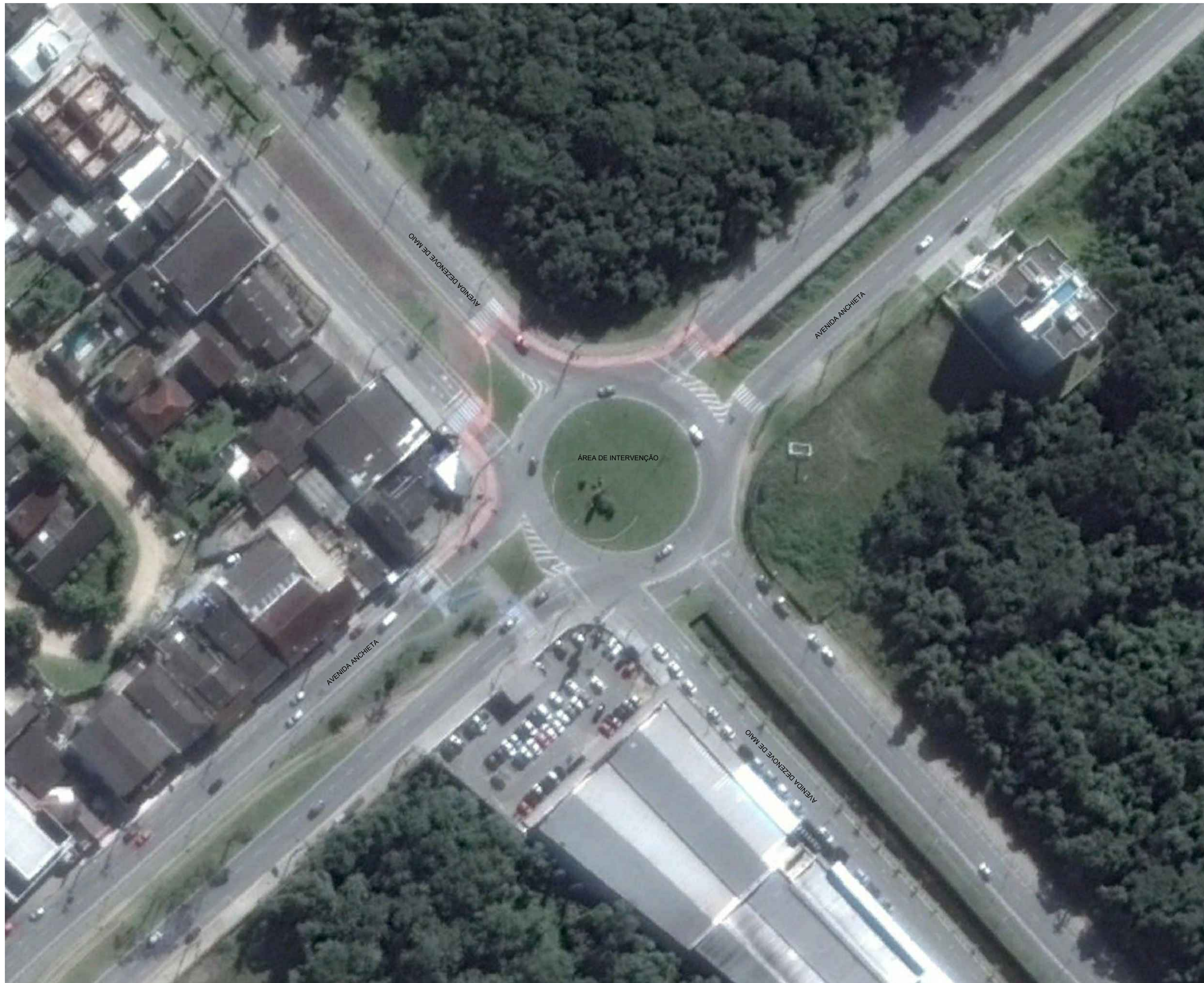
1 SITUAÇÃO ATUAL - LOCALIZAÇÃO Escala 1/500

Nota: ESTE PROJETO ESTÁ DE ACORDO COM AS NORMAS E LEGISLAÇÃO RELATIVOS À NBR 9050 DE ACESSIBILIDADE E A NBR 6492 DE REPRESENTAÇÃO DE PROJETO DE ARQUITETURA.