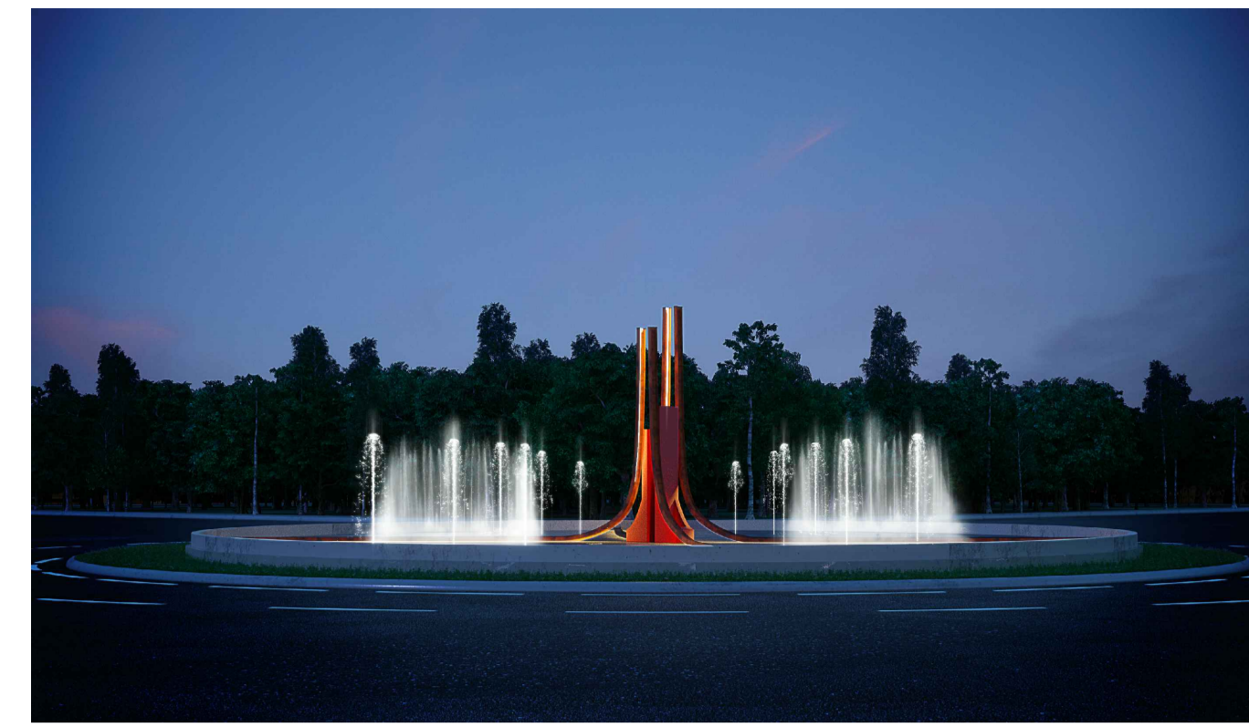
PERSPECTIVA S/ Escala