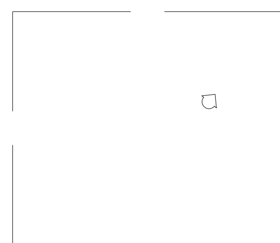
PLANTA COBERTURA 1:200