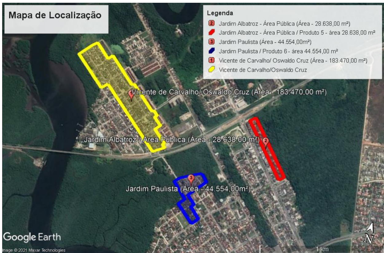
Imagem 1. Núcleos que compõem o Complexo Vicente de Carvalho/ Jardim Paulista

Os núcleos supracitados configuram espaços urbanos de intensa ocupação, expondo uma marca de uso irregular do solo na cidade de Bertioga com as seguintes características: