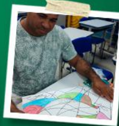
CARTAZ E REDAÇÃO DA PAZ COM PREMIAÇÃO