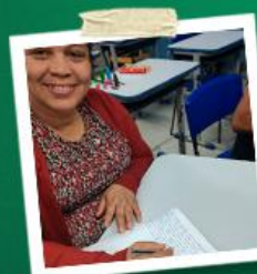
FELIBERT COM PREMIAÇÃO