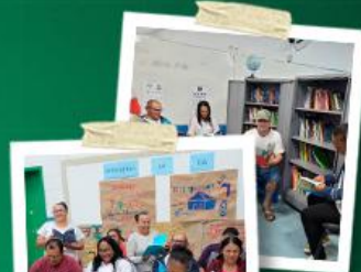
PROJETO DE LEITURA EM PARCERIA COM O SESC & BIBLIOTECA DE RODINHAS