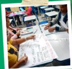
PROFESSORES COMPROMETIDOS E ACOLHEDORES