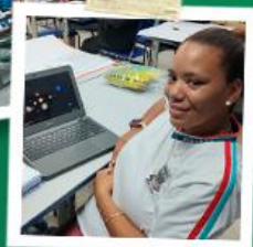
CURSOS DO SEBRAE, SENAC E NA ÁREA DA TECNOLOGIA