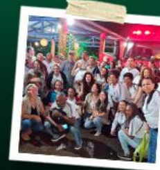
PALESTRAS NO VIVEIRO DE PLANTAS SEM LEO