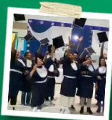
FORMATURA CUSTO ZERO PARA OS ALUNOS