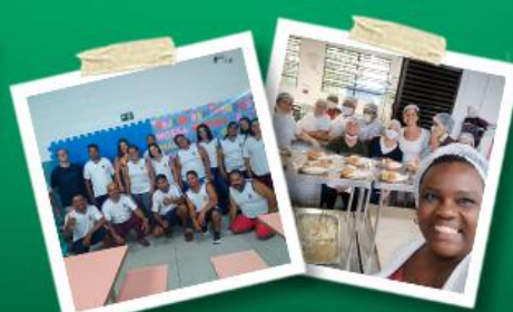
KIT DE MATERIAL ESCOLAR, UNIFORME & JANTAR BALANCEADO PARA OS ALUNOS