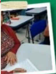
LIBERTAR COM PREMIAÇÃO