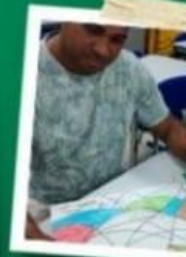
CARTAZ E REDAÇÃO COM PREMIAÇÃO