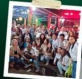
PALESTRAS NO VIVEIRO DE PLANTAS SEM LED