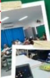
CURSOS DO SEBRAE, SENAC E NA ÁREA DA TECNOLOGIA