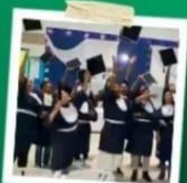
FORMATURA CUSTO ZERO PARA OS ALUNOS