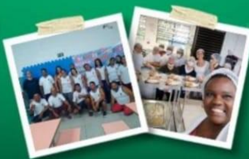
KIT DE MATERIAL ESCOLAR, UNIFORME & JANTAR BALANCEADO PARA OS ALUNOS