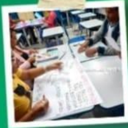
PROFESSORES COMPROMETIDOS E ACOLHEDORES