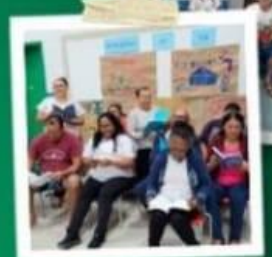
PROJETO DE LEITURA EM PARCERIA COM O SES & BIBLIOTECA DE RODINH